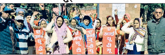
रेवाड़ी। नेताजी सुभाष पार्क में नारेबाजी करते हुए यूनियनों के कार्यकर्ता।