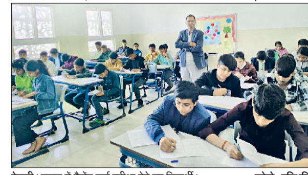
रेवाड़ी। स्कूल में टैलेंट सर्च परीक्षा देते हुए विद्यार्थी।