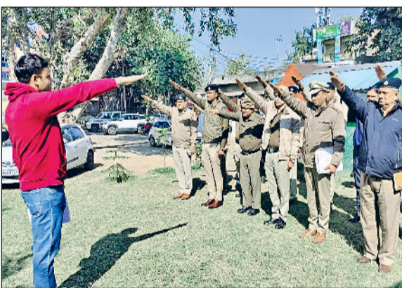
रेवाड़ी। मतदाता दिवस पर शपथ लेते हुए पुलिस कर्मचारियों।