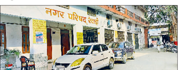
रेवाड़ी। भाड़ावास गेट के पास स्थित नगर परिषद कार्यालय।

नगर परिषद के चुनाव में भाग आजमाने के लिए पहले से तैयार एक केंद्रीय मंत्री के समर्थक को डॉ में चेरमैन की सीट आरक्षित होने से भले ही झटका लगा हो, परंतु उनके लिए 'बीच का रास्ता' अभी तक खुला है। चर्चा है कि नगर परिषद चुनाव लड़वाने के लिए केंद्रीय मंत्री के समर्थक ने जल्द ही एससी समाज की युवती का विवाह अपने बेटे से जल्द कराने की तैयारी शुरू कर दी है। उनके बेटे ने अंतरजातीय विवाह करने की निर्णय लिया था, जिसके बाद पिता ने युवती से बेटे का रिश्ता पहले ही तय कर दिया था। नप चेरमैन का चुनाव लड़ने के लिए कई नए व चुनाव चेरहे डा का इंतजार कर रहे थे। अगर सीट ओपन होती, तो बड़ी संख्या में दावेदार देखने को मिल