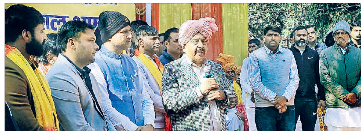
रेवाड़ी। कार्यक्रम में उपस्थित लोगों को संबोधित करते कैबिनेट मंत्री राव नरबीर सिंह।

उद्योग एवं वाणिज्य मंत्री राव नरबीर सिंह ने गांव आसलवास में आयोजित धार्मिक कार्यक्रम में की शिरकत हरिभूमि न्यूज ▶▶ रेवाड़ी