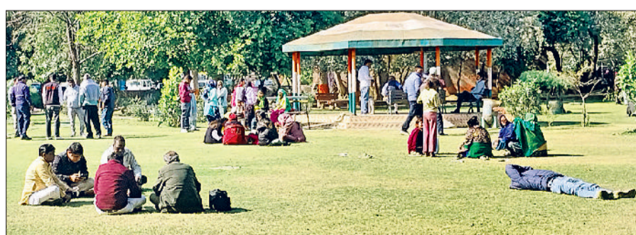
रेवाड़ी। सर्दी से बचाव के लिए नेहरू पार्क में धूप संकेतें लोग।

बनी रहेगी। रविवार को सुबह से ही आसमान साफ रहा। सूरज की तेज चमक से मौसम का मिजाज कुछ गर्म हुआ, लेकिन 14 किलोमीटर प्रति घंटा की रफतार से चली हवाओं ने कंपकंपी छुड़ाने का काम किया। अधिकतम तापमान 1.7 डिग्री सेल्सियस बढ़कर 17.2 डिग्री सेल्सियस पर आ गया। रात का तापमान 4.3 डिग्री सेल्सियस की गिरावट के साथ 1.2 डिग्री सेल्सियस दर्ज किया गया। बीते शनिवार को चली बर्फाली हवाओं के कारण जिले के कुछ एरिया में सुबह के समय पाला भी जमा। हवा में नमी का स्तर 80 प्रतिशत तक रहा। शाम तक हवाओं ने मौसम ठंडा बनाए रखा, जिससे सोमवार को भी पाला जमने के आसार बन गए हैं। मौसम विभाग के अनुसार पश्चिमी विक्षोभ सक्रिय हो रहा है,