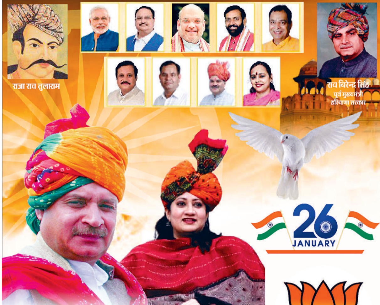
राजा राव तुलाराम