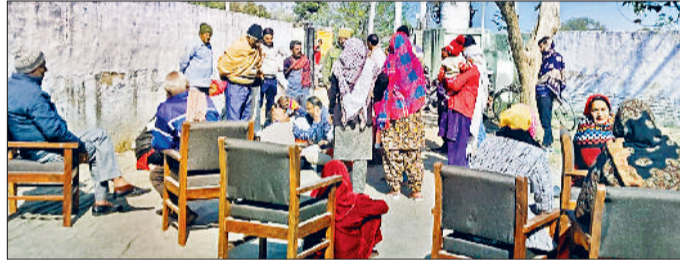
रेवाड़ी। कोरम पूरा नहीं होने पर ग्रामसभा से वापस जाते ग्रामीण।