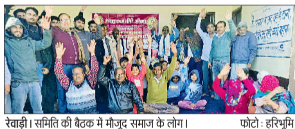
रेवाड़ी। समिति की बैठक में मौजूद समाज के लोग।

बड़ी भागीदारी रही है। उन्होंने कहा कि हरियाणा में उद्योगों के लिए बेहतरीन योजनाएं होने के चलते तेजी से बड़े-बड़े उद्योग स्थापित किए जा रहे हैं। उद्योगों की नीतियों के चलते हरियाणा भी देश को विकसित राष्ट्र बनाने में अहम भूमिका निभाएगा। मंत्री ने ग्रामीणों द्वारा रखी गई मांगों को भी पूरा कराने का आश्वासन दिया।