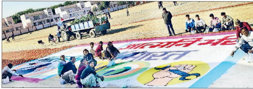
रेवाड़ी। पुलिस लाइन में गणतंत्र दिवस समारोह की तैयारी में रंगोली बनाते आर्टिस्ट।